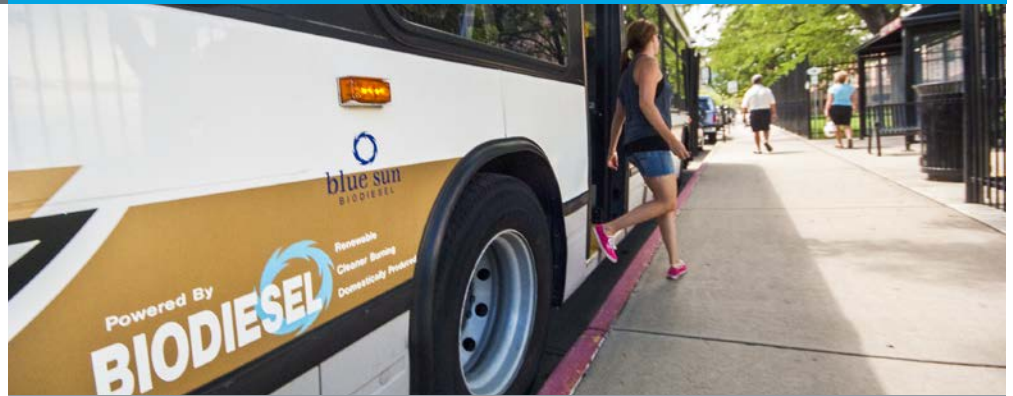
El biodiésel funciona bien en numerosas aplicaciones, como este autobús urbano impulsado por B20 de la Universidad de Colorado, en Boulder.

Actualmente, cada fabricante de equipos originales (OEM, por sus siglas en inglés) de vehículos diésel aprueba las mezclas de hasta B5 en sus vehículos. Casi el 80 % de los OEM ya aprueba las mezclas hasta B20 en algunos o